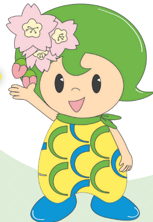
京都中央信用金庫イメージキャラクター オンユアちゃん