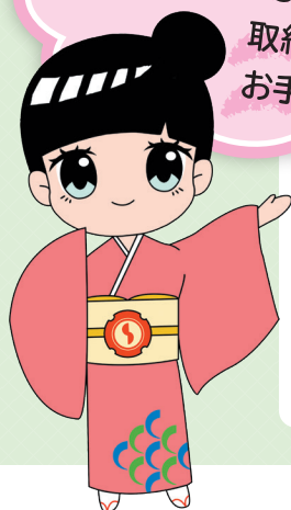
京都中央信用金庫イメージキャラクター ゆあちゃん

「京都中信SDGs宣言サポート」が、 お客さまのSDGs達成へ向けた 取組みの「見える化」を お手伝いいたします。