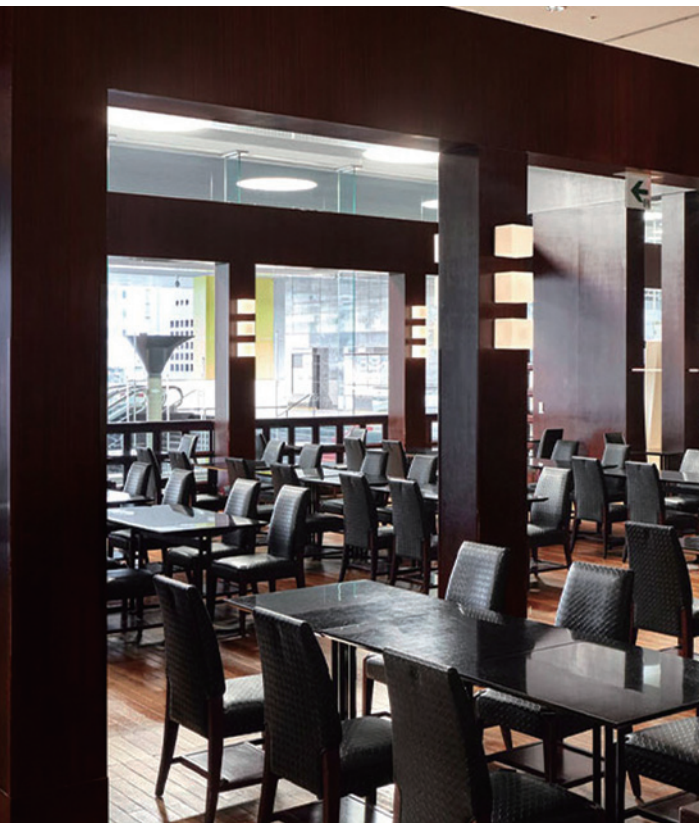
※写真はすべてイメージです