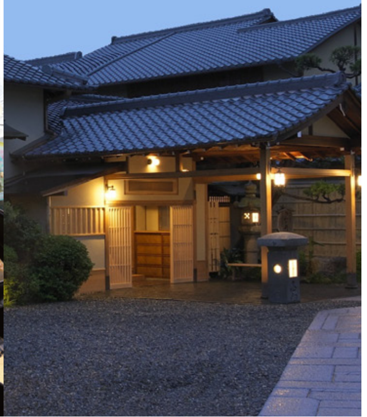
※写真はすべてイメージです