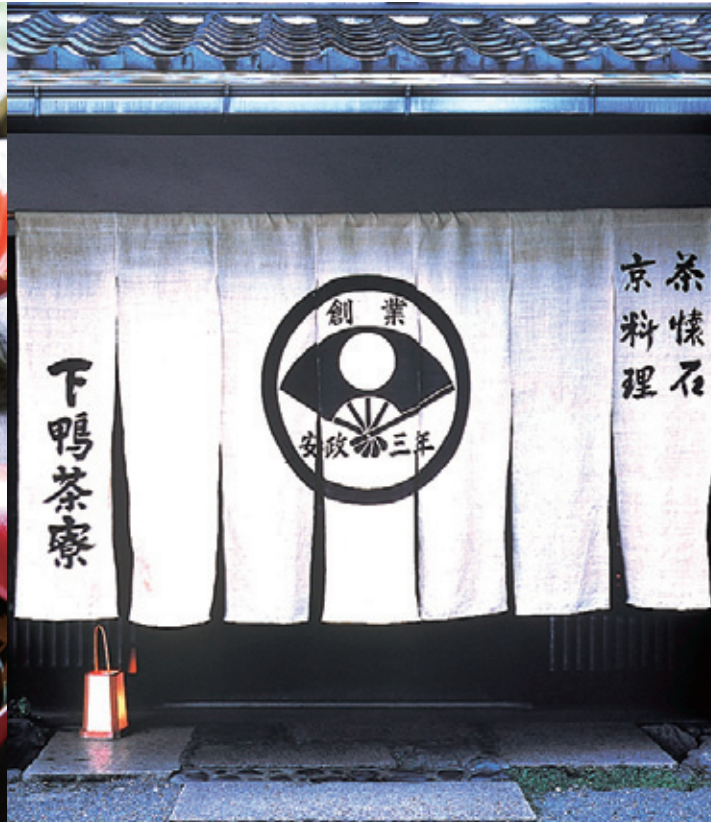
※写真はすべてイメージです