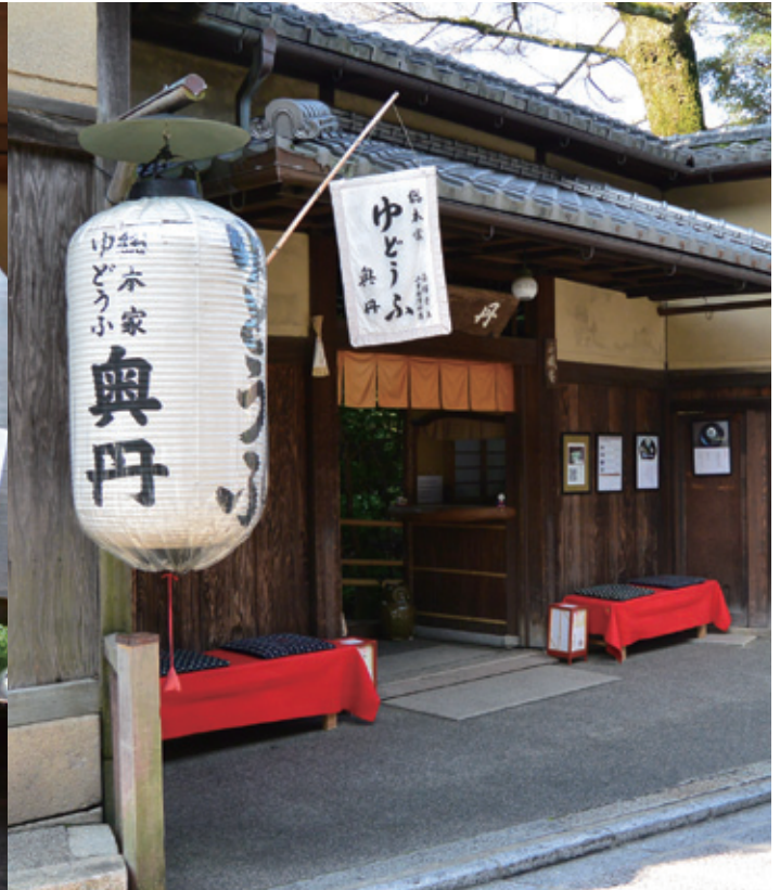
※写真はすべてイメージです