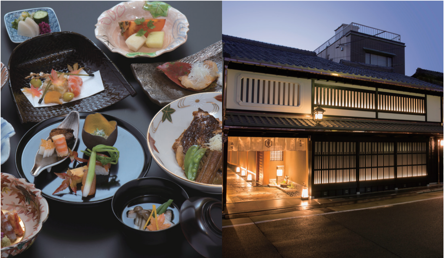
※写真はすべてイメージです