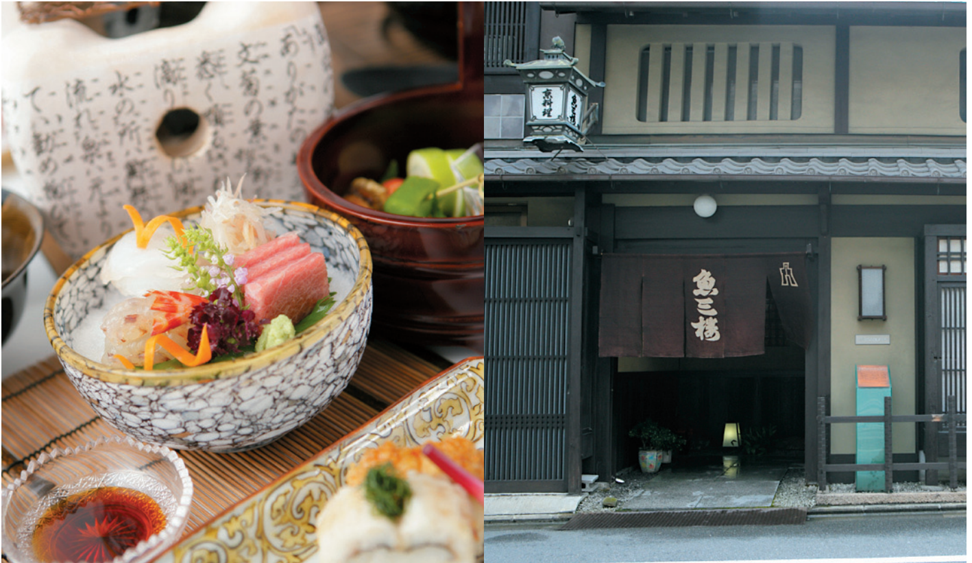
※写真はすべてイメージです