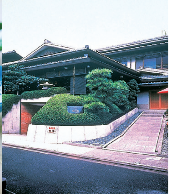
※写真はすべてイメージです