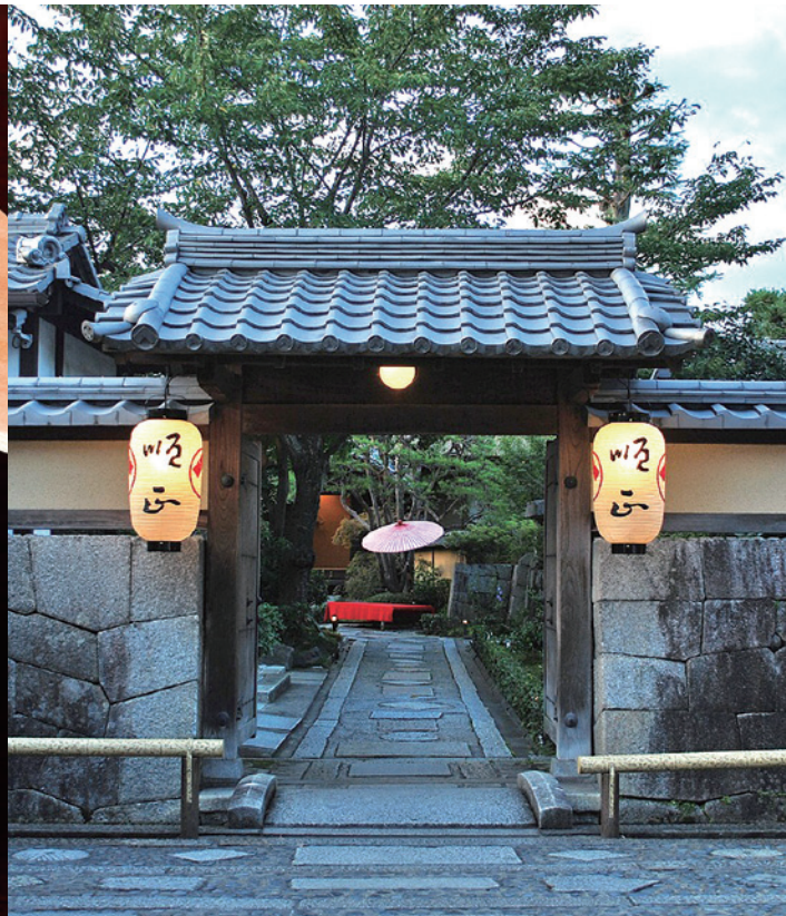
※写真はすべてイメージです