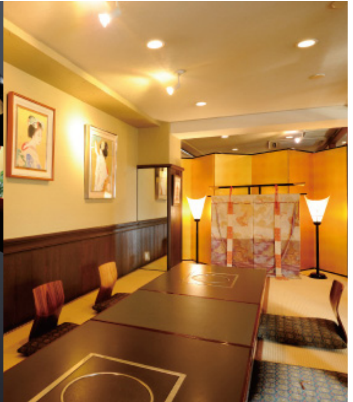
※写真はすべてイメージです