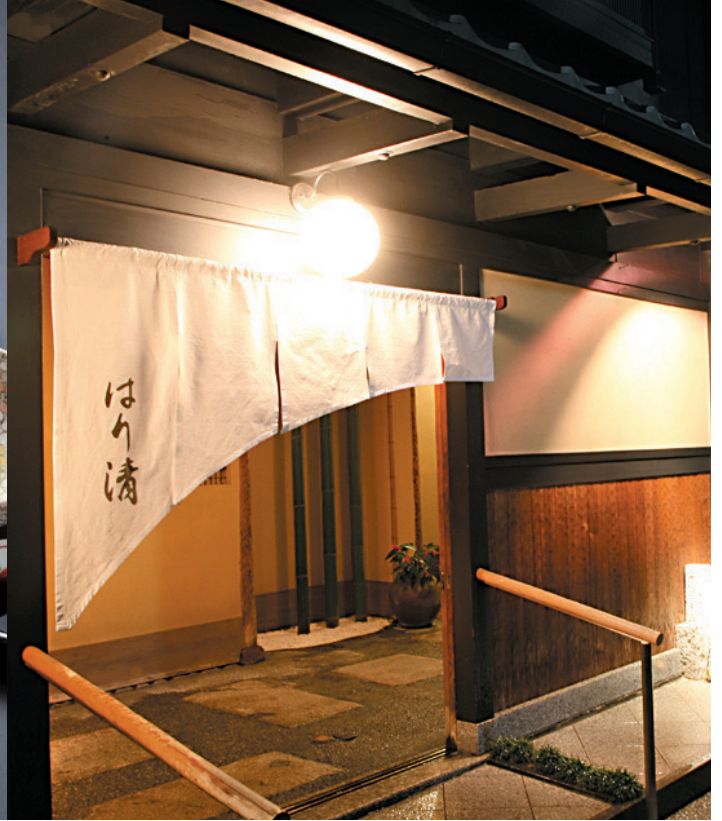
※写真はすべてイメージです