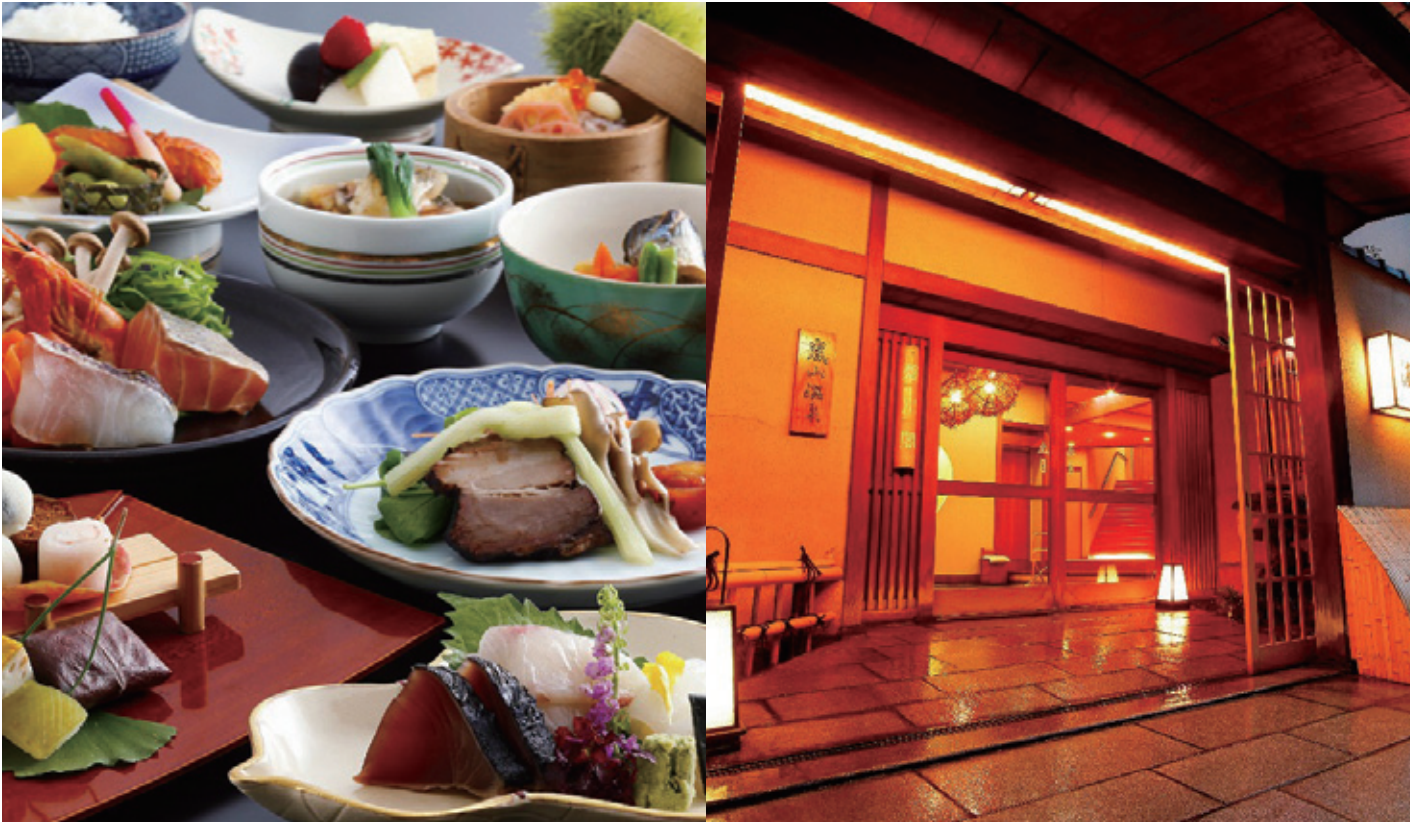
※写真はすべてイメージです